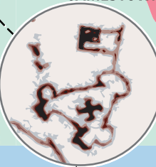
Tekening van Jamestown Fort in 1607