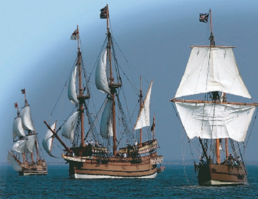
Replica's van de schepen in Jamestown, de Susan Constant (midden), de Godspeed (links) en de Discovery

Op 14 mei 1607 arriveren 108 mannen en jongens die gesponsord waren door de Virginia Company of London in Noord-Amerika. Ze stichten er de kolonie Jamestown, genoemd naar koning James I van Engeland. Deze kolonie is de eerste permanente Engelse nederzetting in wat nu de Verenigde Staten van Amerika zijn.