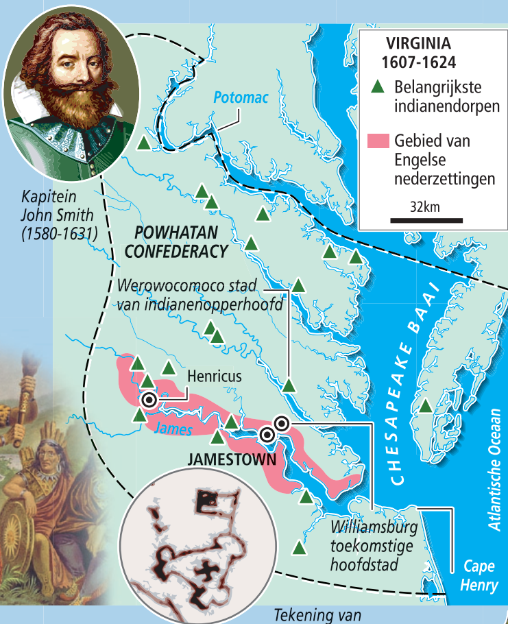
Kapitein John Smith (1580-1631)

Nieuwe kolonisten en voorraden komen aan uit Londen als 60 overlevenden op het punt staan Jamestown te verlaten